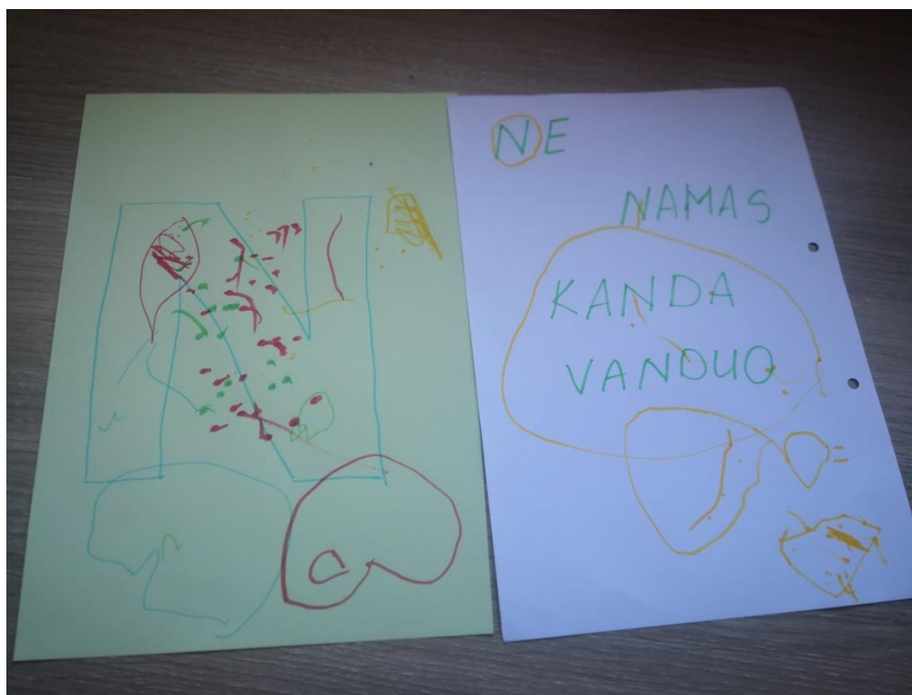
Planą ir knygą „Renatos abėcėlė“ parengė mokytoja Renata Grėbliūnė