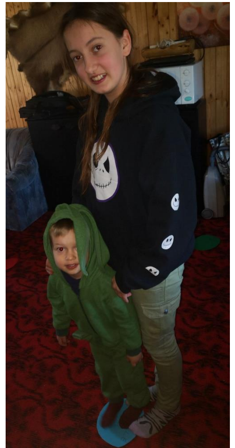
Planą parengė mokytoja Renata Grėbliūnė.